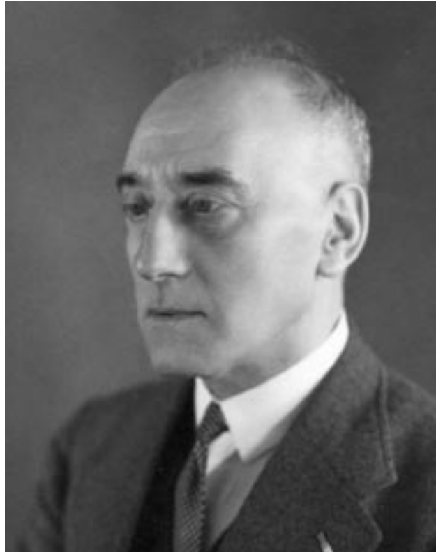
Ernst Julius Cohen

Het algemene beeld van hoe de Akademie handelde tijdens de oorlog wijkt niet erg af van hoe het elders ging, volgens Knegtmans. Het dagelijks functioneren ging