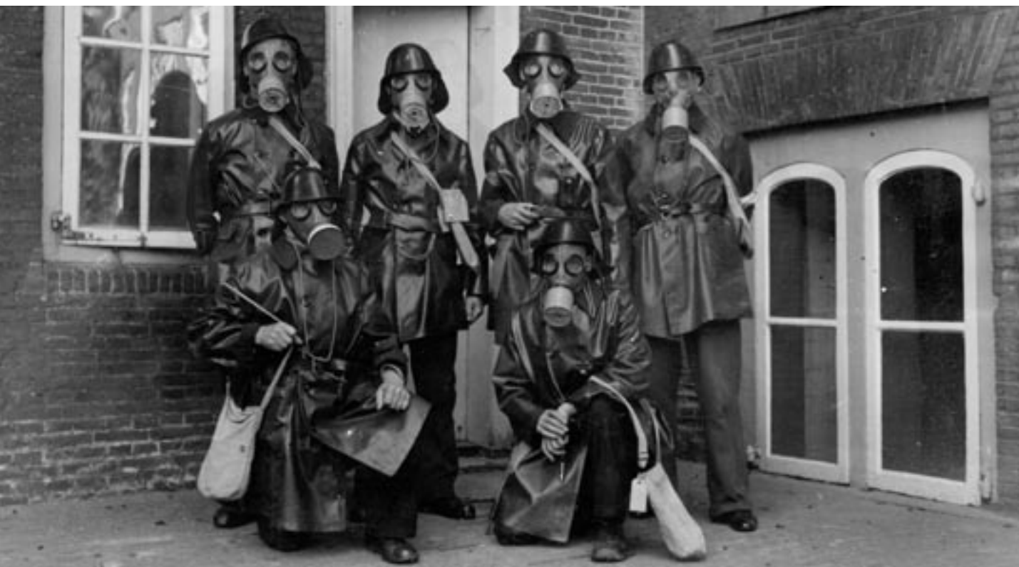
Tijdens de oorlog was in het Trippenhuys een post van de 'Kunstbeschermingsdienst' gevestigd