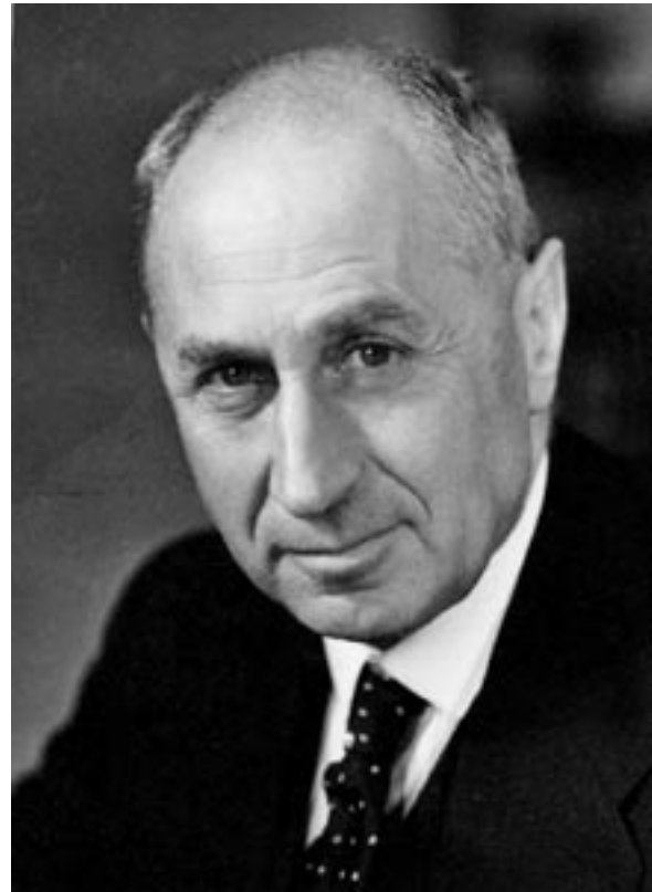
Eduard Maurits Meijers